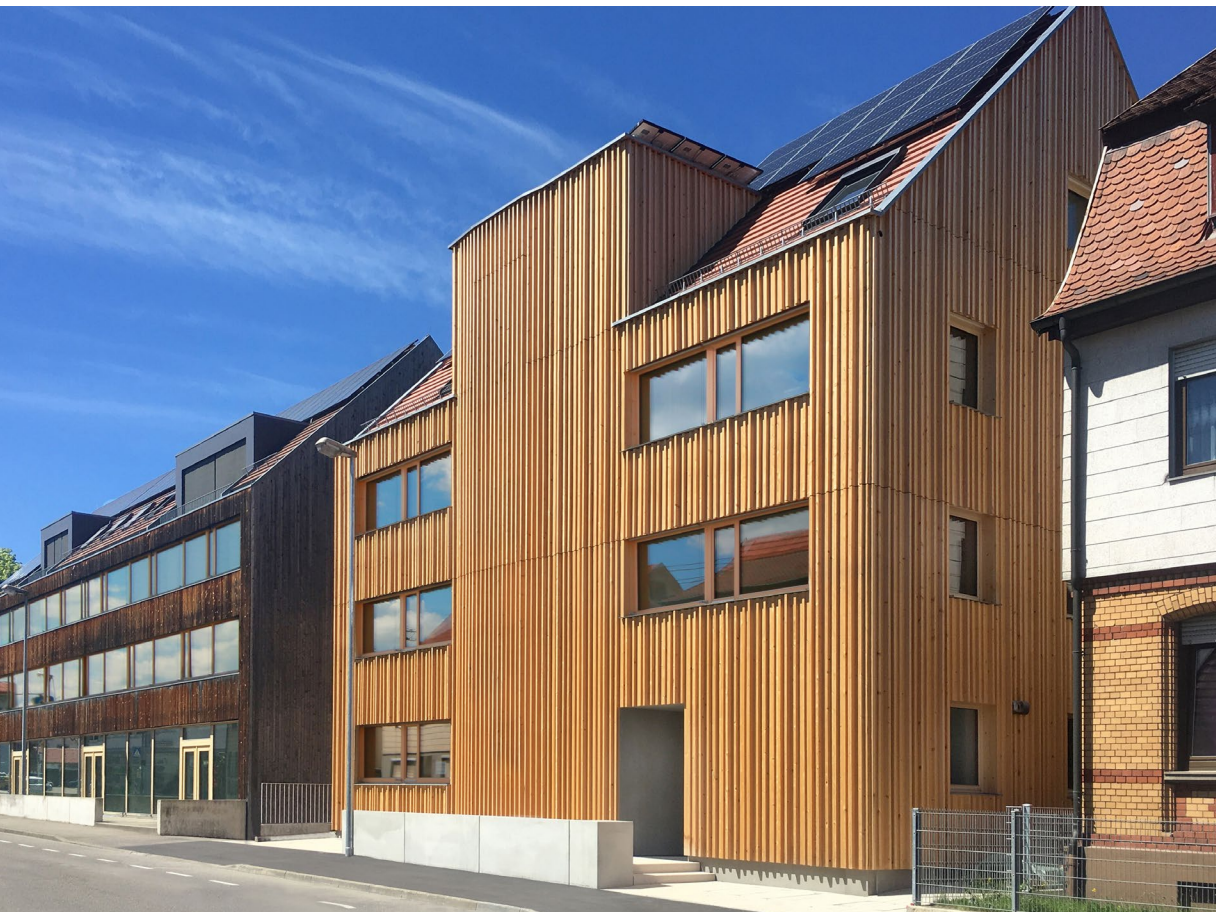
Das Eisbärhaus in Kirchheim unter Teck.